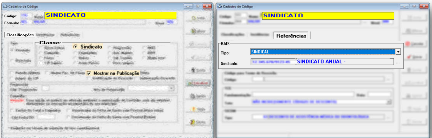
Cadastro de códigos