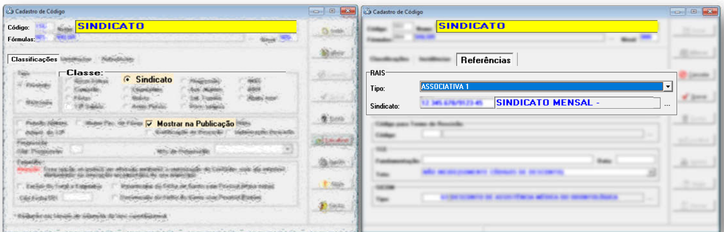
Cadastro de códigos