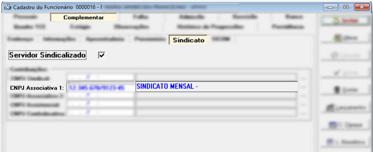
Cadastro de Funcionários